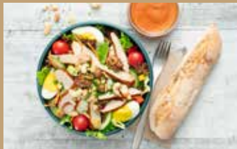
Salat + Dressing + Baguette

Tom & Sally's Salat-Combo: knackiger Salat-Mix mit leckeren Toppings, außergewöhnlichem Dressing und ofenfrischer Baguette-Stange jeweils separat dazu.