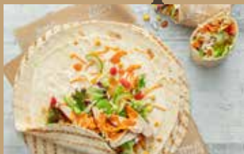
Gefüllter Weizenfladen (inkl. Dressing)

Unsere Salate gerollt für „auf die Hand“ – mit knackigem Salat-Mix, leckeren Toppings, veganer Salat-Creme und außergewöhnlichem Dressing verfeinert.