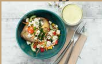
Gefüllte Ofenkartoffel + Dressing

Die warme „Salat-Kartoffel!“ mit Creme-Quark, leckeren Toppings und außergewöhnlichem Dressing zum Verfeinern separat dazu.